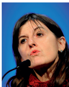
Pr Karine Clément

Un point sur les dernières connaissances concernant le tissu adipeux a été brillamment présenté par le Pr Karine Clément , chercheur à l'INSERM. Ce tissu, souvent considéré à tort comme un simple réservoir énergétique, assure aussi le stockage et la production de diverses substances à activité autocrine, paracrine et